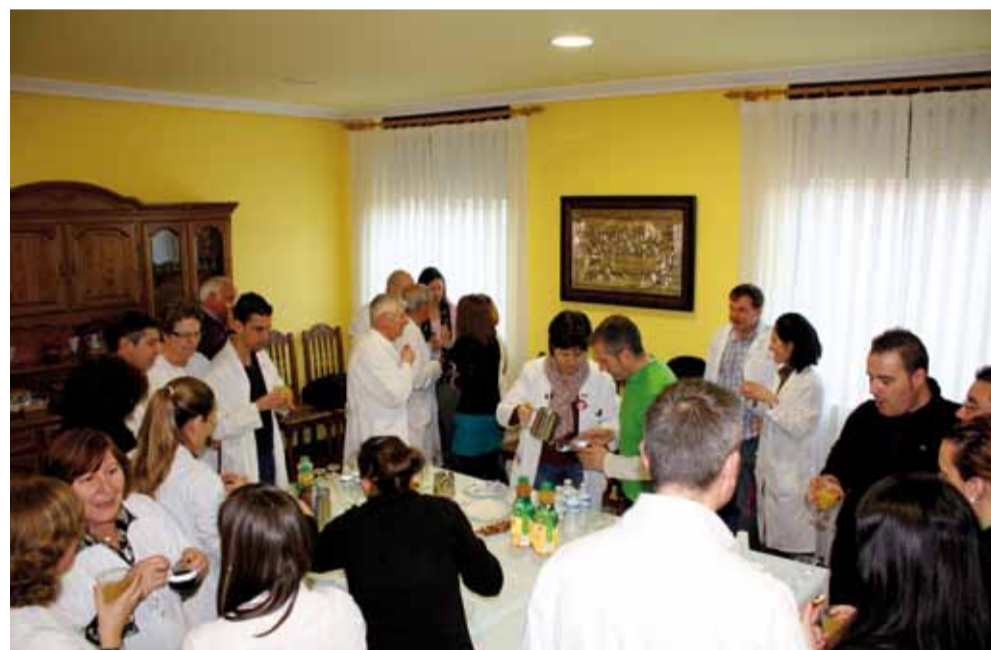
Tras la presentación de las educadoras, los trabajadores compartieron un café.