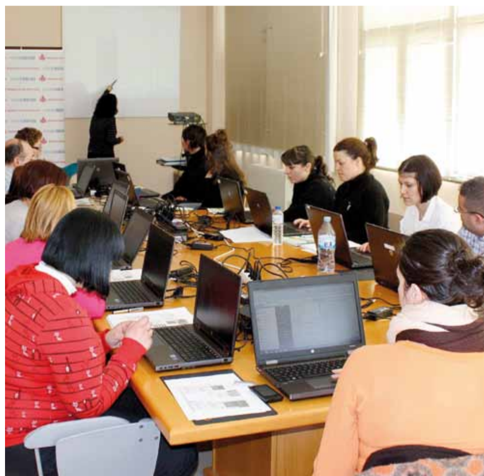
Trabajadores en uno de los cursos de Excel desarrollados en el centro.

Los cursos convocados en los meses de marzo y abril para personal del Marítimo de Gijón han resultado un éxito. El curso de Hoja de Cálculo Excel , de 20 horas de duración, dirigido a personal del centro, y entre cuyos objetivos estaba el de adquirir los conocimientos necesarios para elaborar y manejar una hoja de cálculo, tuvo tanta demanda que hubo que celebrar dos cursos. El primero, que tuvo lugar del 12 al 27 de marzo, y el segundo del 9 al 24 de abril, cada uno con 15 alumnos.