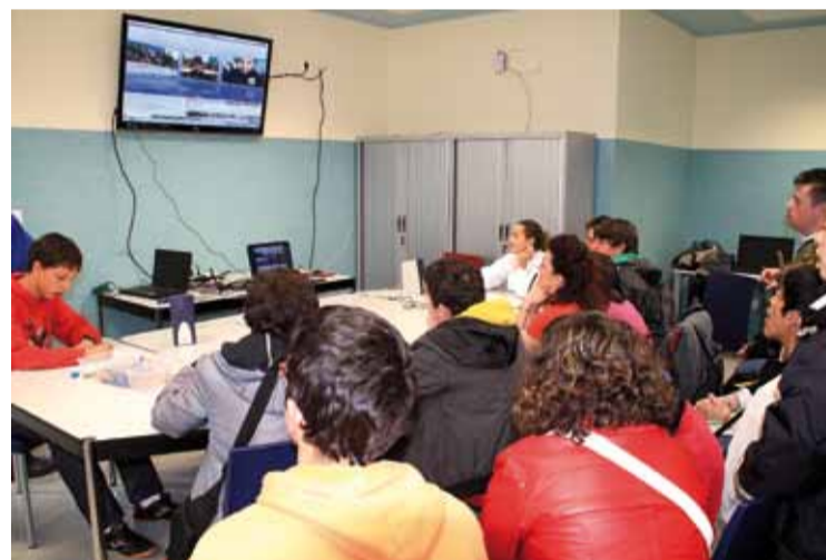
Izquierda: Videoconferencia desarrollada en el Marítimo, dentro del programa de intercambio cultural.

quiera compartir, un docente comprometido, un voluntario apasionado, debe seguir. Y seguirá. De pocas cosas, a mi ya no tan joven edad, estoy tan seguro.