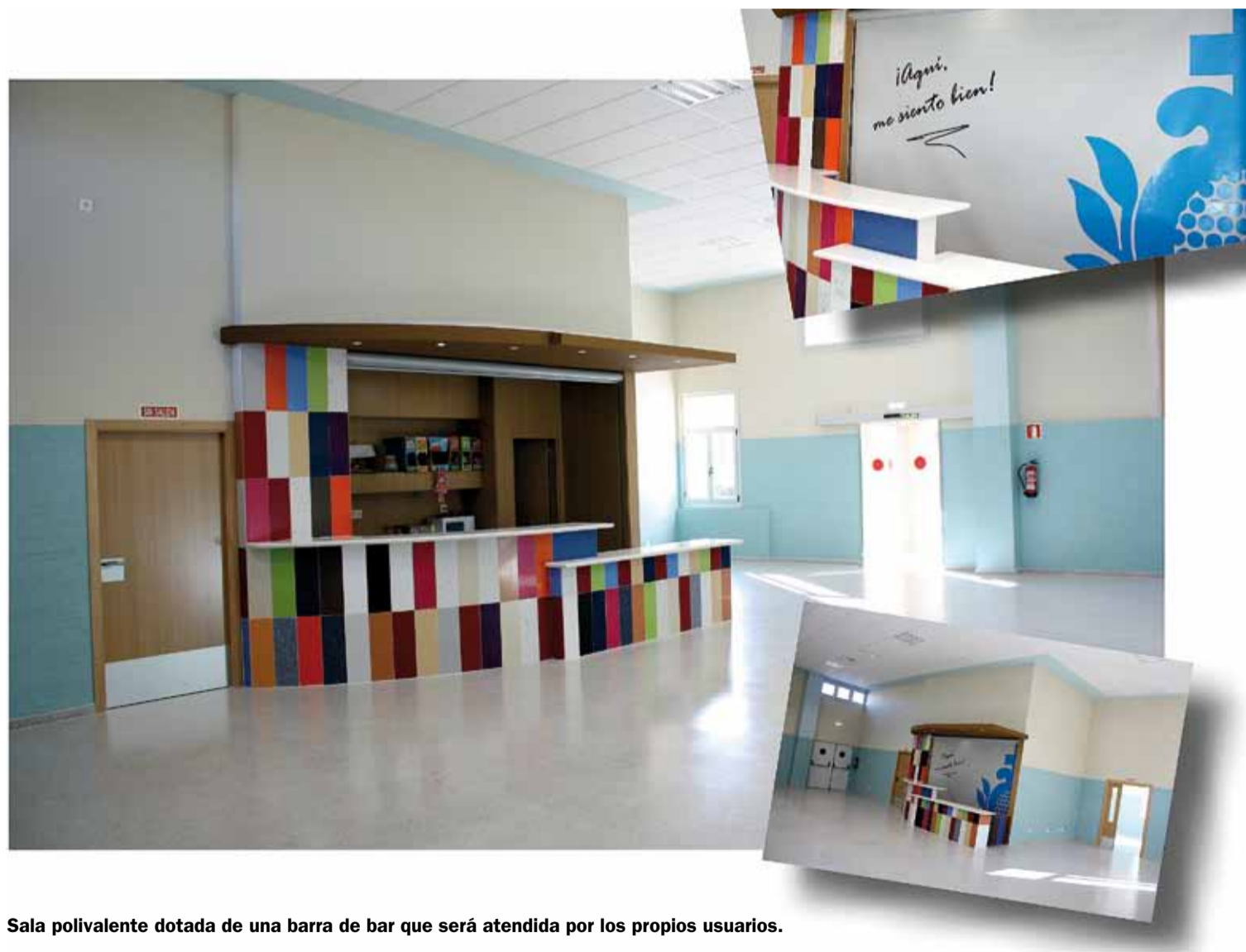
Sala polivalente dotada de una barra de bar que será atendida por los propios usuarios.

En definitiva, se trata de adecuar las infraestructuras a la actual normativa autonómica en materia de acreditación de centros de servicios sociales, así como de “adaptar el centro a las nuevas necesidades derivadas de la dependencia de las personas con discapacidad en proceso de envejecimiento y mejorar la calidad de vida de los usuarios del centro y sus familias”.