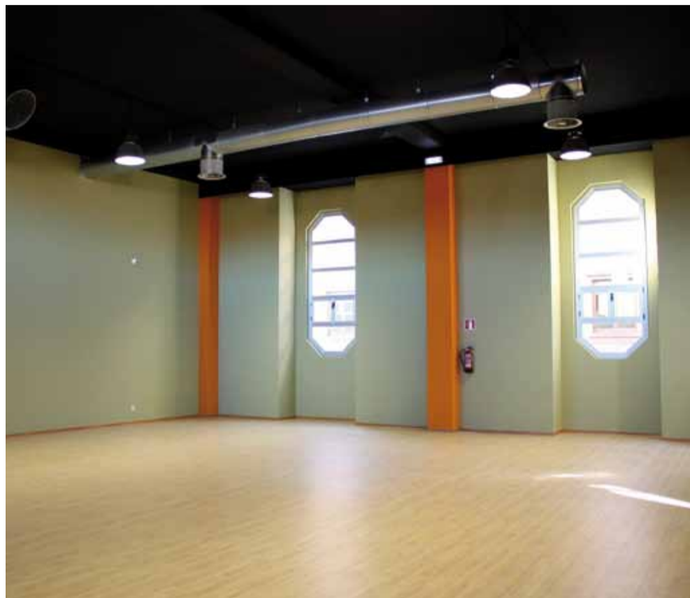
Imagen del espacio habilitado como polideportivo.

Entre el equipamiento de las nuevas salas se incluye material de psicoestimulación, material audiovisual, informático, deportivo, escenográfico, mobiliario (mesas, sillas, estanterías, armarios) y ayudas técnicas como asideros y pasamanos. Una de las salas estará principalmente dedicada para actividades de psicomotricidad y deportivas, contando igualmente