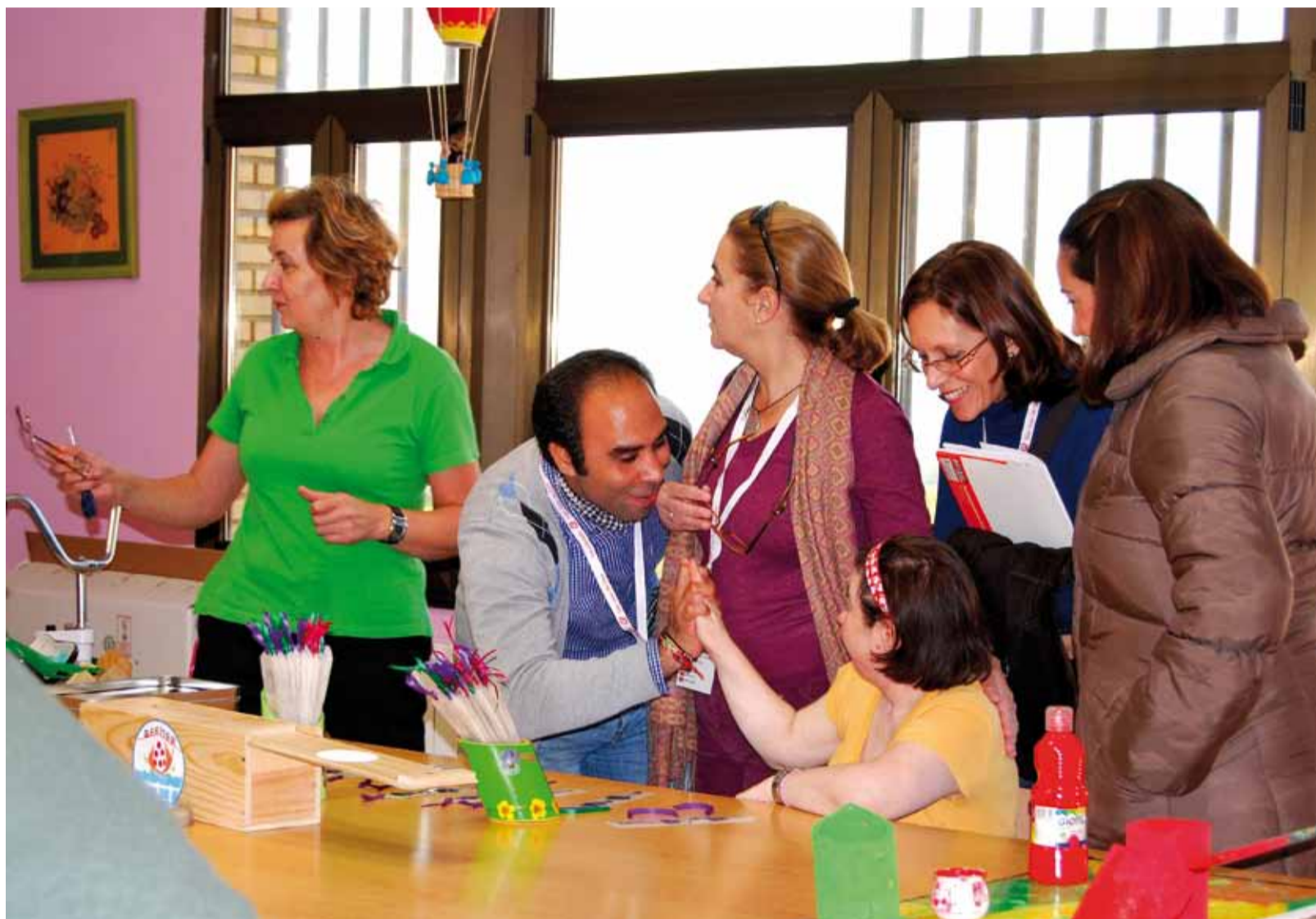
Los voluntarios recorrieron el centro y conocieron la actividad realizada por las personas usuarias.

“Aunque ya sabemos que en el sector de las personas con discapacidad intelectual, la relación voluntario-usuario es enriquecedora para ambas partes,