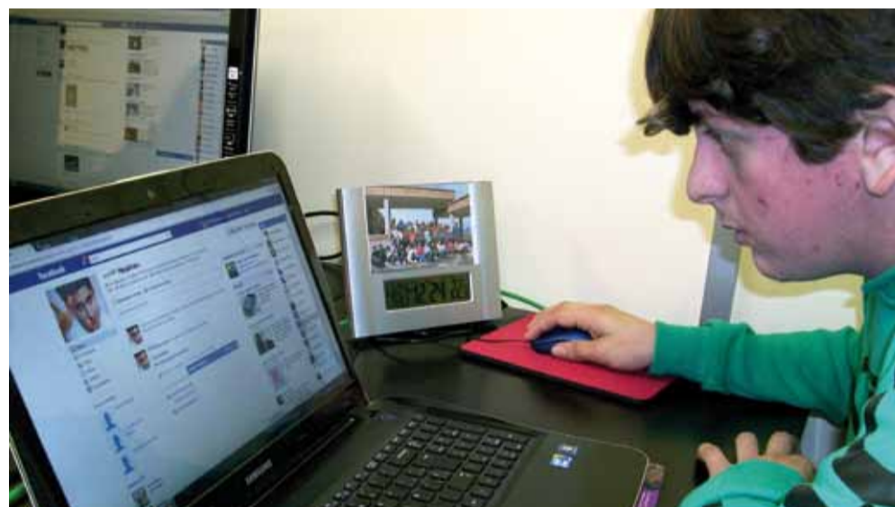
Arriba: Vista general del nuevo aula de comunicación. Sobre estas líneas: Uno de los usuarios, participante en el aula de comunicación.

cer las instalaciones del centro. "La jornada fue muy provechosa para alumnado y voluntarias y así nos lo hicieron llegar las trabajadoras de Telefónica, quienes agradecieron el esfuerzo realizado desde el Colegio y el Centro para integrarlas en nuestra comunidad", aseguran desde el propio Colegio.