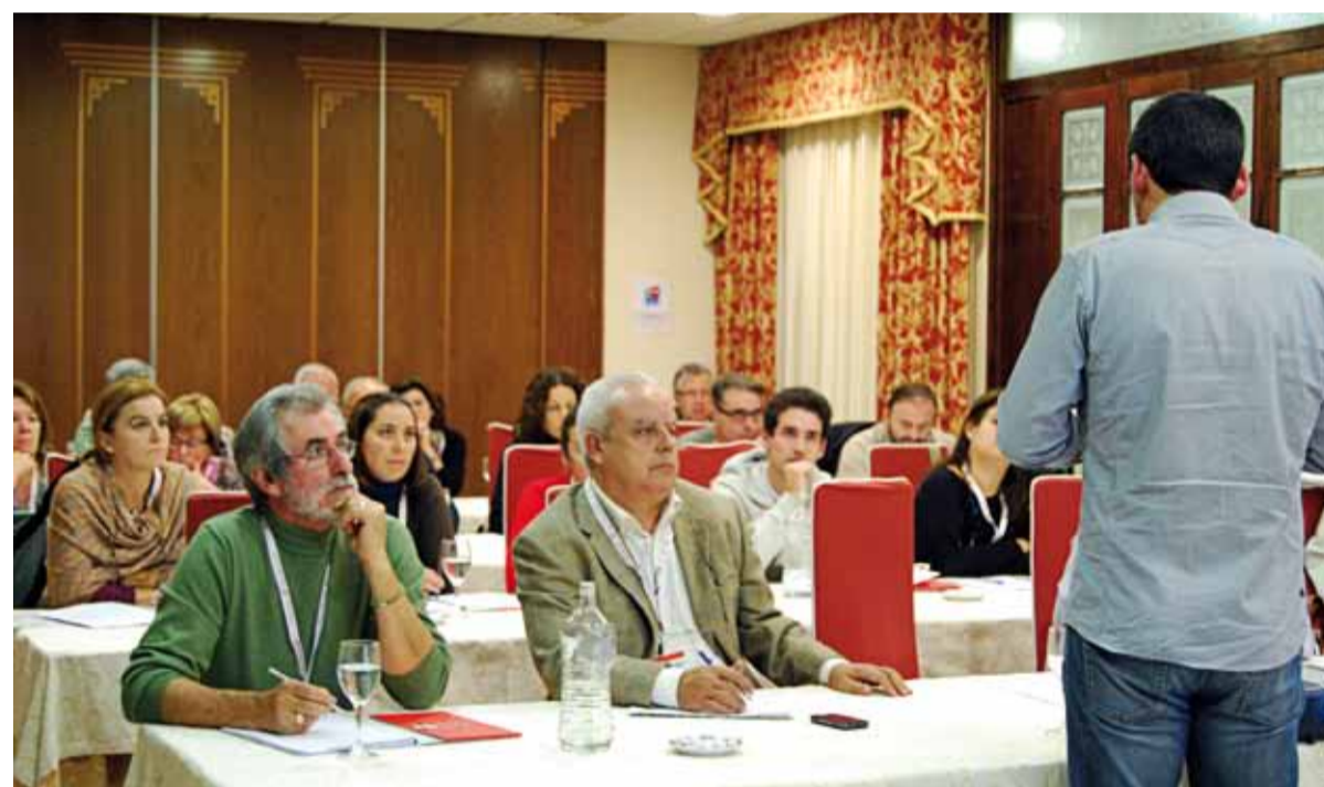
Unos 71 voluntarios y coordinadores de voluntariado de varios centros de la Orden de San Juan de Dios de toda España asistieron al encuentro.

porque lo que está diciendo es algo muy profundo, por lo que hay que ser sensibles y evitar un tono infantil”. También relacionado con ello, planteó como una cualidad que deben tener los voluntarios en este ámbito, el saber escuchar, y “estar abiertos a formas de comunicación no verbal a través de las cuales se expresan en muchas ocasiones” las personas con discapacidad. No mentir nunca, ser pacientes,