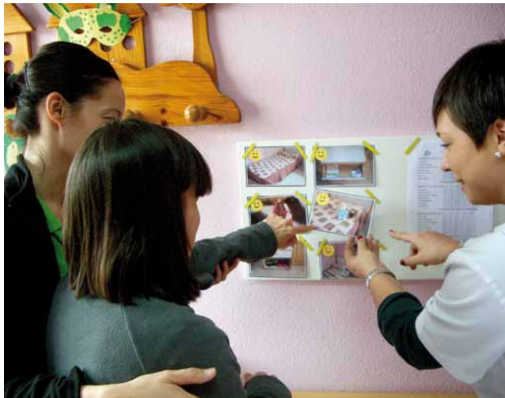
Se estableció un programa muy concreto usando fotografías colocadas en una pizarra metálica de lo que es correcto y de lo que no lo es.

Era, también de forma previa, muy importante, establecer una relación, ganarse su confianza, con el fin de obtener su colaboración. Esto permitió poder enseñarle algunas habilidades sociales, esta-