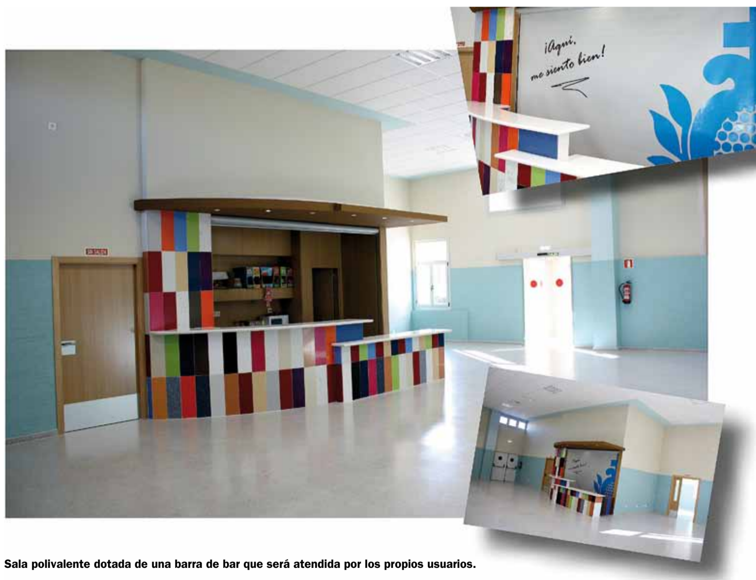
Sala polivalente dotada de una barra de bar que será atendida por los propios usuarios.

En definitiva, se trata de adecuar las infraestructuras a la actual normativa autonómica en materia de acreditación de centros de servicios sociales, así como de “adaptar el centro a las nuevas necesidades derivadas de la dependencia de las personas con discapacidad en proceso de envejecimiento y mejorar la calidad de vida de los usuarios del centro y sus familias”.