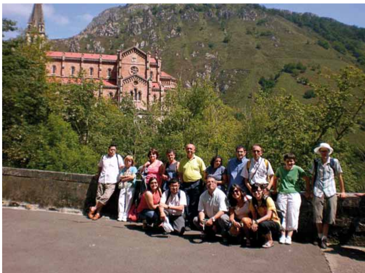
Participantes de la experiencia MAGIS con residentes del centro en su excursión a Covadonga.

La experiencia ha sido muy positiva para todos y ha permitido el encuentro entre personas de diversos orígenes, permitiendo aprender más sobre uno mismo y el mundo que nos rodea, y como anunciaba el lema MAGIS: "encontrar a Cristo en el corazón del Mundo".