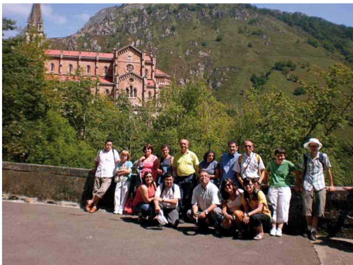
Participantes de la experiencia MAGIS con residentes del centro en su excursión a Covadonga.

La experiencia ha sido muy positiva para todos y ha permitido el encuentro entre personas de diversos orígenes, permitiendo aprender más sobre uno mismo y el mundo que nos rodea, y como anunciaba el lema MAGIS: "encontrar a Cristo en el corazón del Mundo".