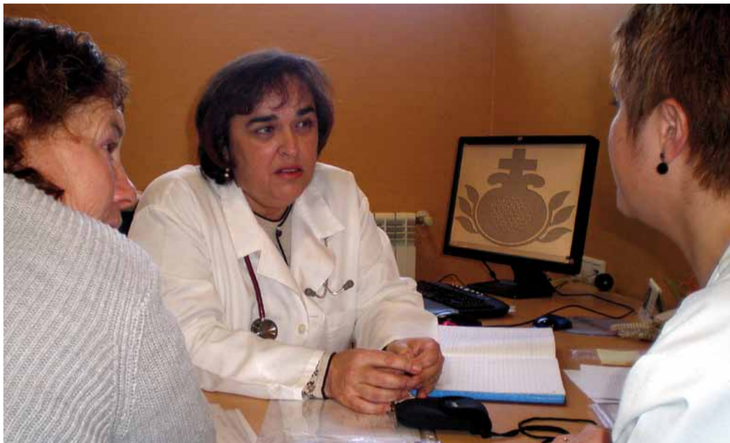
ARRIBA: La doctora realiza un examen rutinario a una de las usuarias del centro. SOBRE ESTAS LÍNEAS. En consulta, con una paciente y una de las cuidadoras.

servicio de comedor; si bien las dietas más específicas vienen pautadas directamente por los especialistas. Otra de mis funciones es también la orientación en hábitos saludables como fundamental medida preventiva de salud.