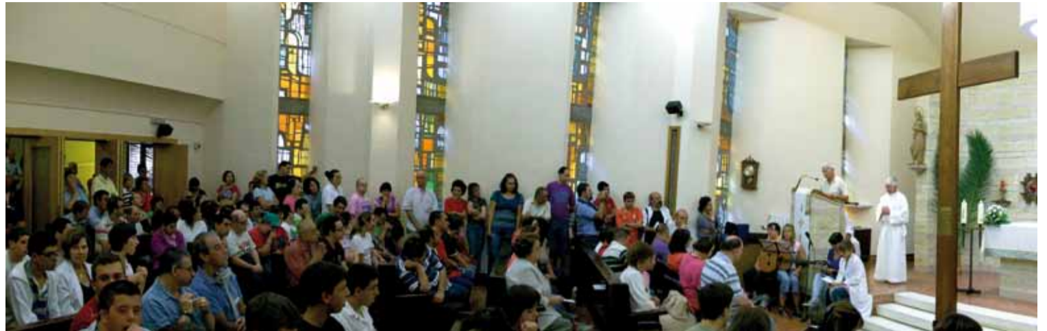
Un momento de la celebración, ante la Cruz de la Juventud.

El Marítimo recibió en septiembre una visita especial. El día 9, la Cruz de la Juventud, la que el Papa Juan Pablo II confió a los jóvenes de todo el mundo en el Domingo de Pascua de 1985, hizo una parada en el centro, dentro de su recorrido de peregrinación por la Diócesis de Asturias, enmarcada en la preparación del encuentro con la juventud del Papa Benedicto XVI, que tendrá lugar del 11 al 21 de agosto de 2011, en Madrid.